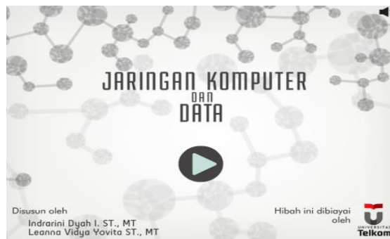
Gambar 2. Tampilan awal modul