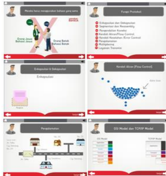
Gambar 4. Contoh tampilan materi