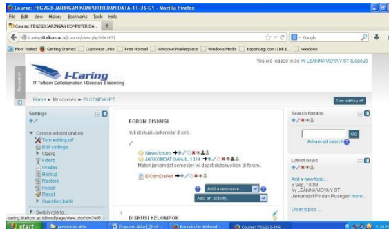
Gambar 1. ICaring Jaringan Komputer dan Data

Konten multimedia yang dibuat terdiri dari 2 modul, yaitu Communication Protocol dan Subnetting pada IPv4. Kedua materi ini dilengkapi dengan ilustrasi dan audio yang berisi penjelasan mengenai materi terkait sehingga mahasiswa diharapkan dapat lebih mudah dalam memahami materi. Modul ini dibuat menggunakan adobe flash. Tampilan awal modul ditunjukkan pada gambar 2 dan pilihan untuk masuk ke sub materi ditunjukkan pada gambar 3.