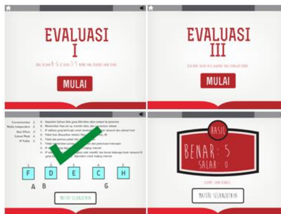
Gambar 5. Contoh tampilan evaluasi

Modul e-learning mengenai IPv4 dibuat untuk menjelaskan pengalamatan IPv4 dan subnetting pada IPv4. Mahasiswa ditargetkan untuk dapat memahami mengapa perlu dilakukan subnetting IPv4, melakukan subnetting dan mengaplikasikannya pada kasus tertentu serta menganalisis akibat dari subnetting itu sendiri terhadap pengalamatan dan alur komunikasi pada jaringan. Materi e-learning berisi penjelasan mengenai subnetting dan cara melakukannya dan kemudian evaluasi dilakukan untuk menguji pengetahuan serta kemampuan aplikasi dan analisis mahasiswa. Materi ini dibuat dalam bentuk animasi menggunakan flash dan video tutorial 'Subnetting' yang dapat diakses pada alamat www.youtube.com/watch?v=gf1pHJg3AF0&feature=youtu.be . Tampilan video tutorial ditunjukkan pada gambar 6.