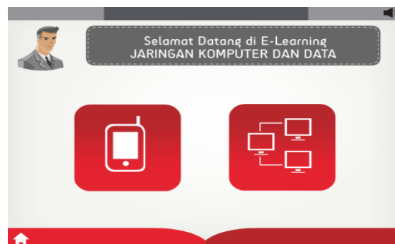
Gambar 3. Pilihan untuk modul Communication Protocol dan IPV4

Modul Communication Protocol dibuat untuk menjelaskan overview paket data, mengilustrasikan interaksi antar layer pada protokol referensi OSI dan protocol model TCP/IP, serta proses pengiriman pesan informasi. Contoh tampilan materi modul Communication Protocol seperti ditunjukkan pada gambar 4.